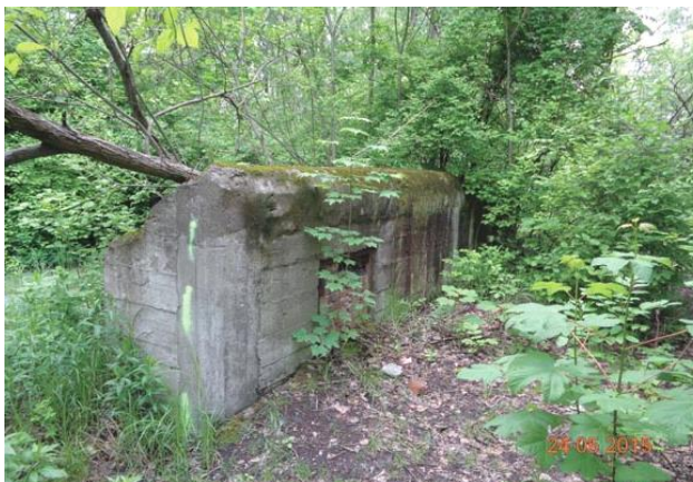
Widok z południowego wschodu

7. Fotografia z opisem wskazującym orientację w stosunku do sąsiednich terenów lub stron świata albo mapa z zaznaczonym stanowiskiem archeologicznym