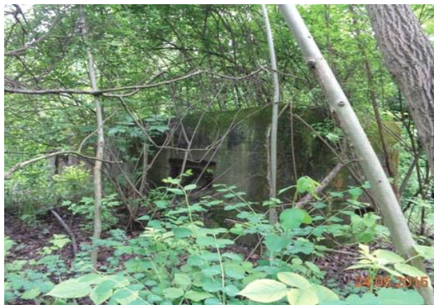
Widok z północnego-wschodu

4. Adres: * 1 Maja/ Hallera, N50 17 11.3 E18 51 20.3