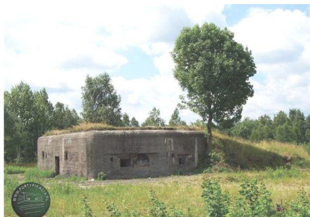
Widok od północnego-wschodu

7. Fotografia z opisem wskazującym orientację w stosunku do sąsiednich terenów lub stron świata albo mapa z zaznaczonym stanowiskiem archeologicznym