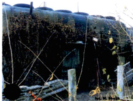
zdjęcie nr 76. Wejście do schronu