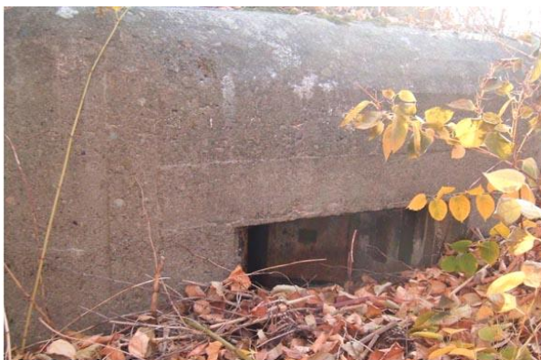
Widok od wschodu, wejście

7. Fotografia z opisem wskazującym orientację w stosunku do sąsiednich terenów lub stron świata albo mapa z zaznaczonym stanowiskiem archeologicznym