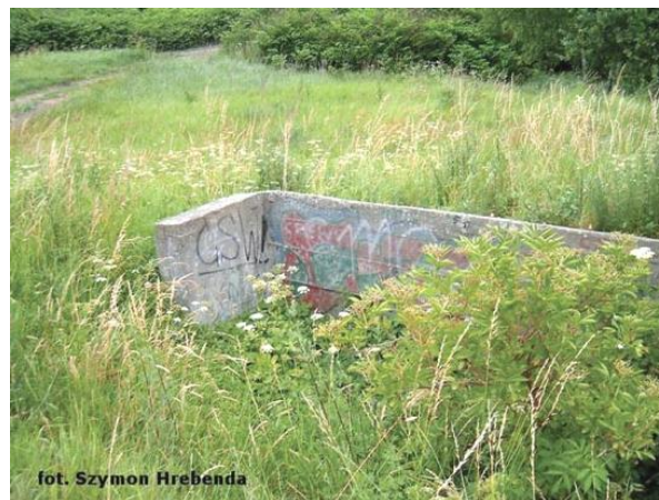
Widok wnętrza części pozornej obiektu