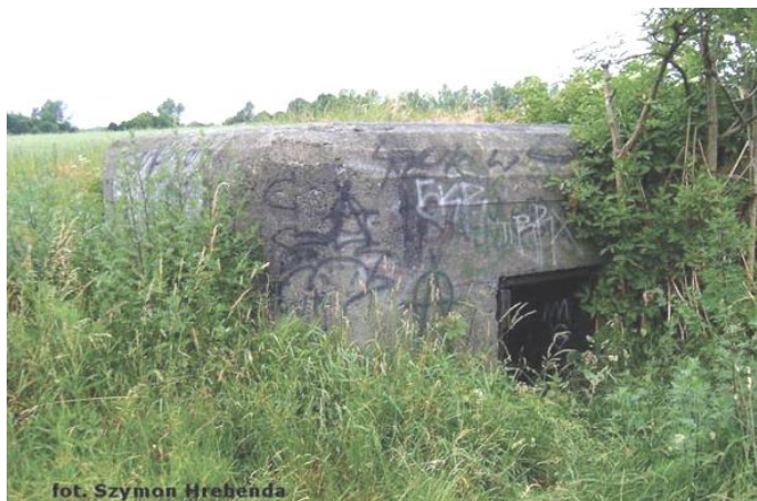
Widok obiektu od wschodu

7. Fotografia z opisem wskazującym orientację w stosunku do sąsiednich terenów lub stron świata albo mapa z zaznaczonym stanowiskiem archeologicznym