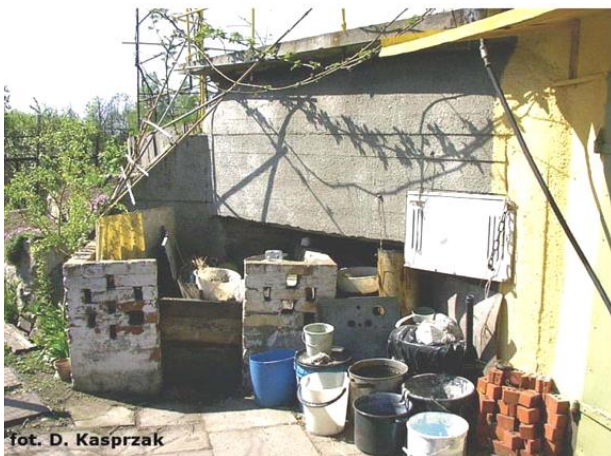
Widok obiektu od wschodu

§6 ust. 8 pkt 9 miejscowego planu zagospodarowania przestrzennego miasta Ruda Śląska (uchwała nr PR.0007.93.2021 z dnia 27.07.2021 r., ogłoszona w Dz. Urz. Woj. Śląskiego z 2021 r., poz. 5110)