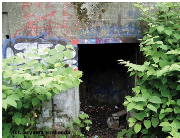
Wejście do schronu