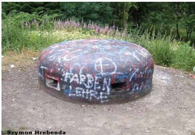
widok kopuły pancерnej

7. Fotografia z opisem wskazującym orientację w stosunku do sąsiednich terenów lub stron świata albo mapa z zaznaczonym stanowiskiem archeologicznym