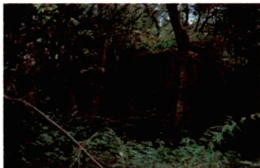
Zdjęcie nr 74. Widok ze wschodu