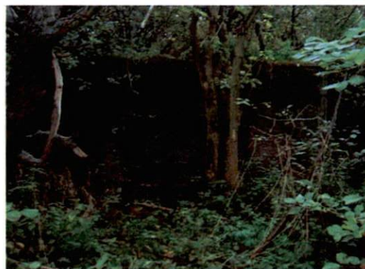
Zdjęcie nr 73. Widok od południa