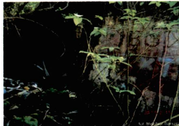
Zdjęcie nr 29. Wejście