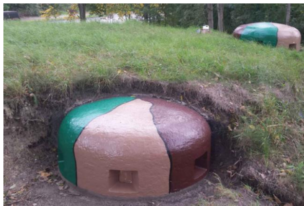
Widok z północy