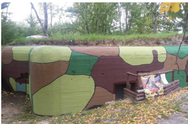
Widok z południowego wschodu

7. Fotografia z opisem wskazującym orientację w stosunku do sąsiednich terenów lub stron świata albo mapa z zaznaczonym stanowiskiem archeologicznym