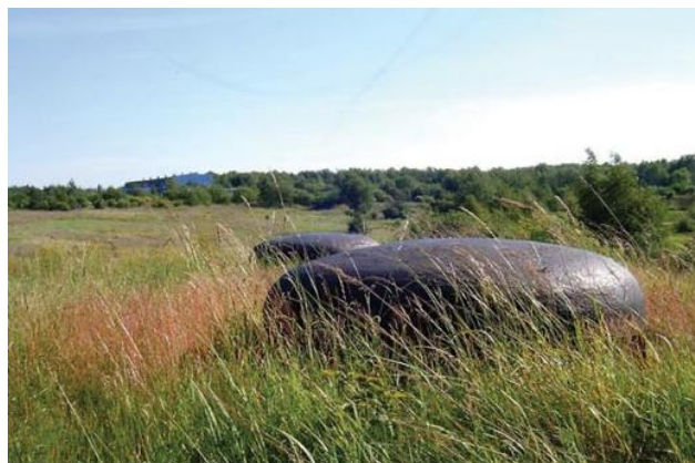
widok z północnego-wschodu