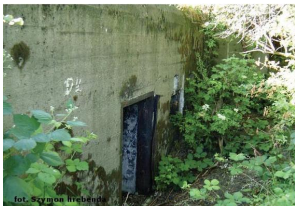
widok z południowego-wschodu

7. Fotografia z opisem wskazującym orientację w stosunku do sąsiednich terenów lub stron świata albo mapa z zaznaczonym stanowiskiem archeologicznym