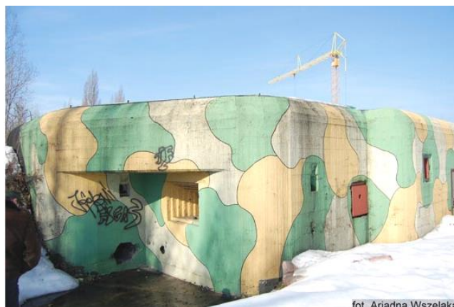
Widok z południa