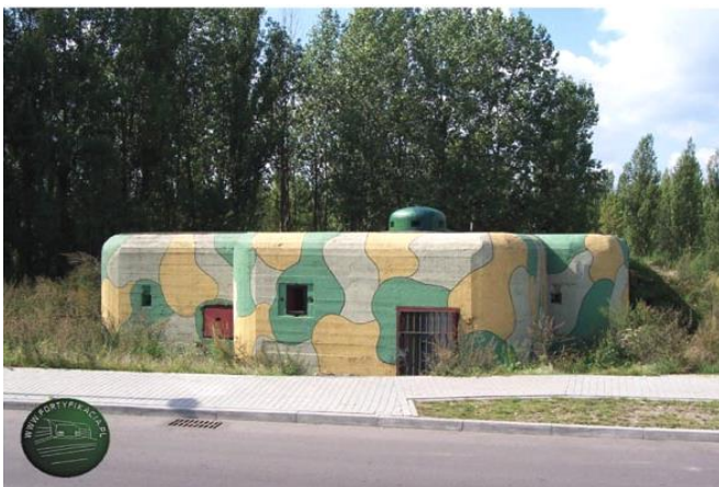
Widok z północnego-wschodu

7. Fotografia z opisem wskazującym orientację w stosunku do sąsiednich terenów lub stron świata albo mapa z zaznaczonym stanowiskiem archeologicznym