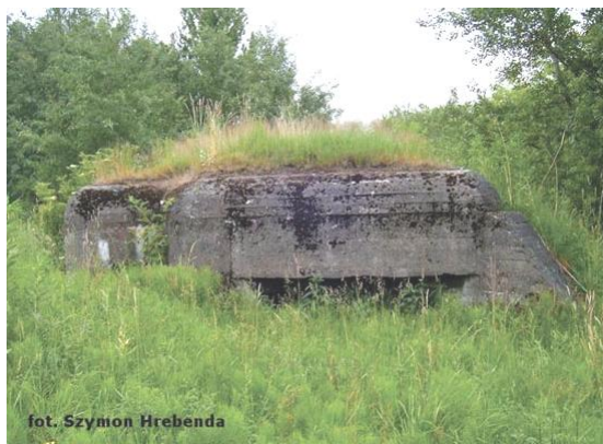
widok od północy

7. Fotografia z opisem wskazującym orientację w stosunku do sąsiednich terenów lub stron świata albo mapa z zaznaczonym stanowiskiem archeologicznym