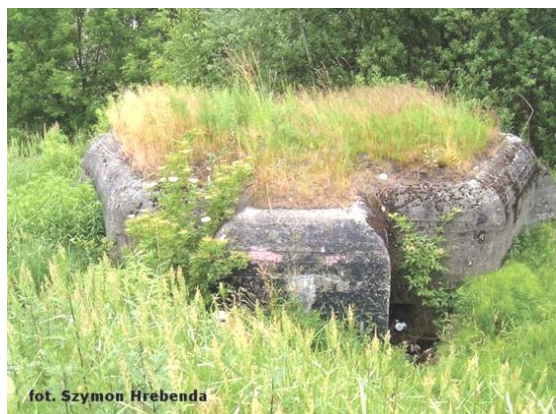
widok od wschodu