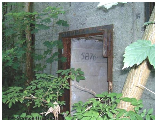
Widok od wschodu, wejście

7. Fotografia z opisem wskazującym orientację w stosunku do sąsiednich terenów lub stron świata albo mapa z zaznaczonym stanowiskiem archeologicznym